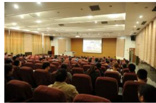
员工畅谈表达坚决拥护新一届中央领导集体。